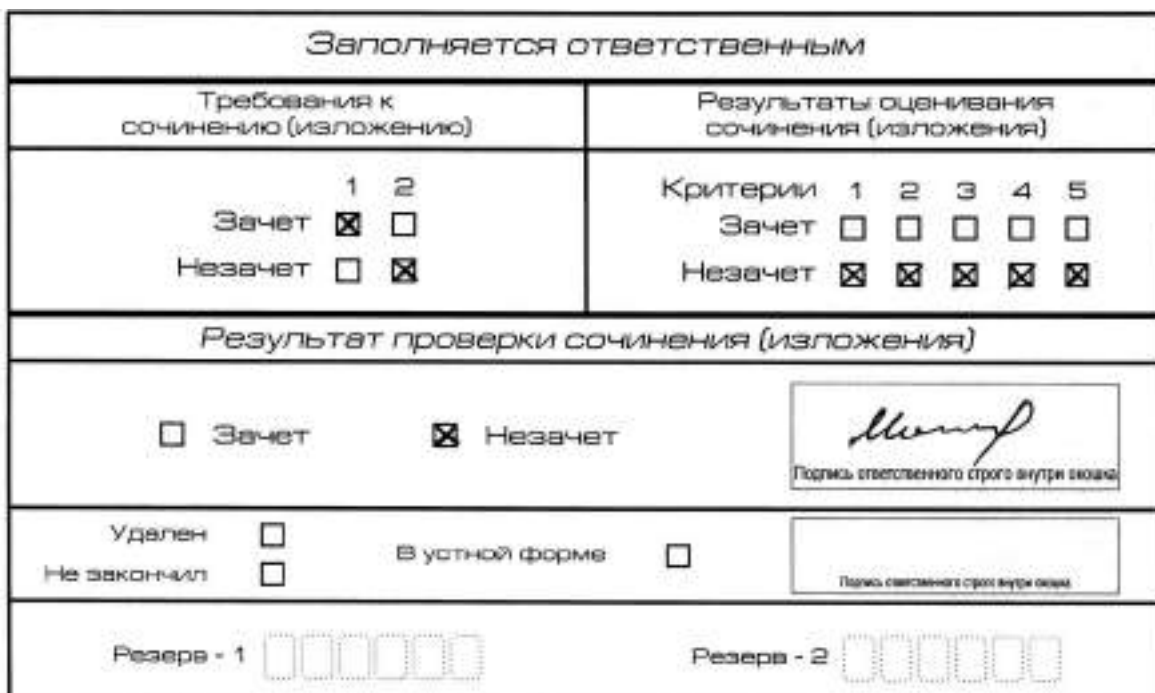
Рис. 9. Область для оценки работы

Если итоговое сочинение (изложение) соответствует требованию № 1 и требованию № 2, то выставляется «зачет» за выполнение требования № 1 и требования № 2. Указанные сочинения (изложения) далее оцениваются по критериям.